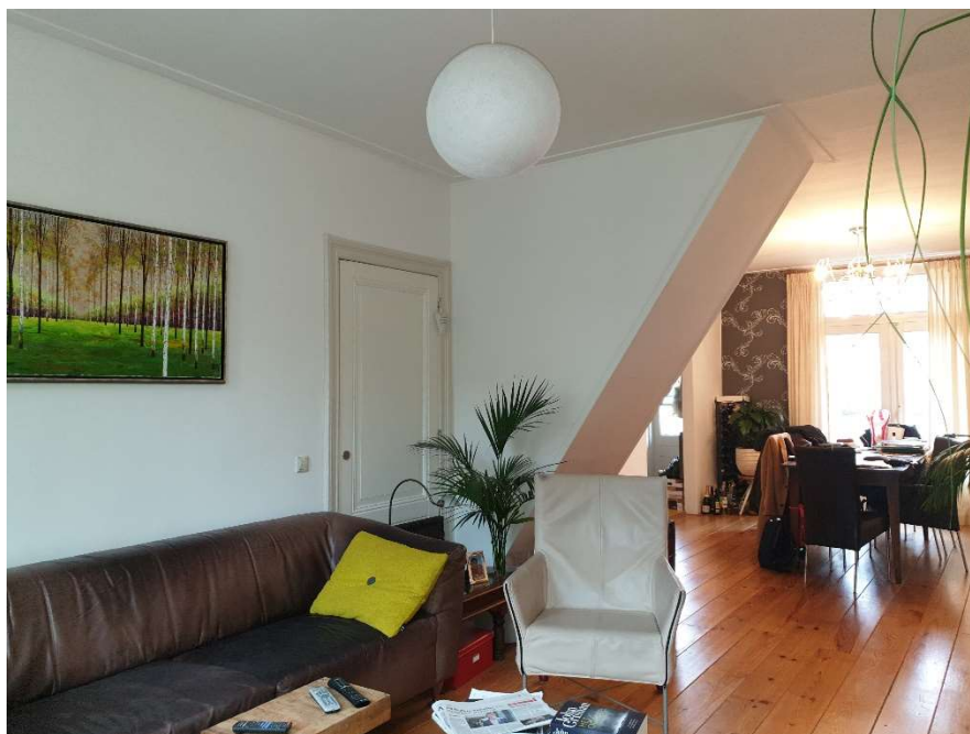
Afbeelding 3 Wand binnen tussen woonkamer en hal.