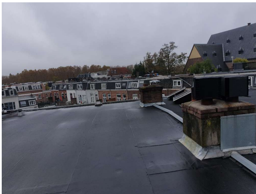
Afbeelding 5 Huidige dak