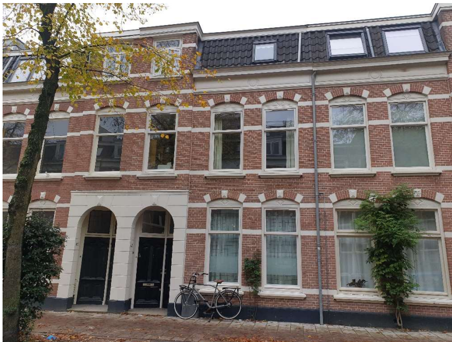
Afbeelding 1 Bestaande voorgevel. Links nr 40, in het midden nr 42 en rechts nummer 44.