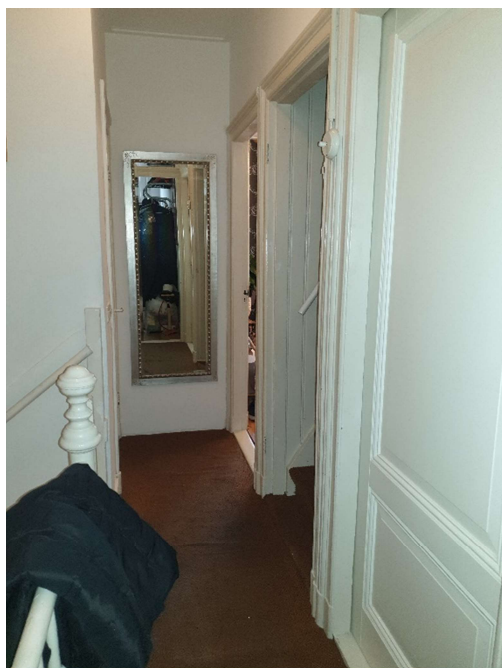
Afbeelding 4 Wand binnen tussen hal, woon kamer en keuken.