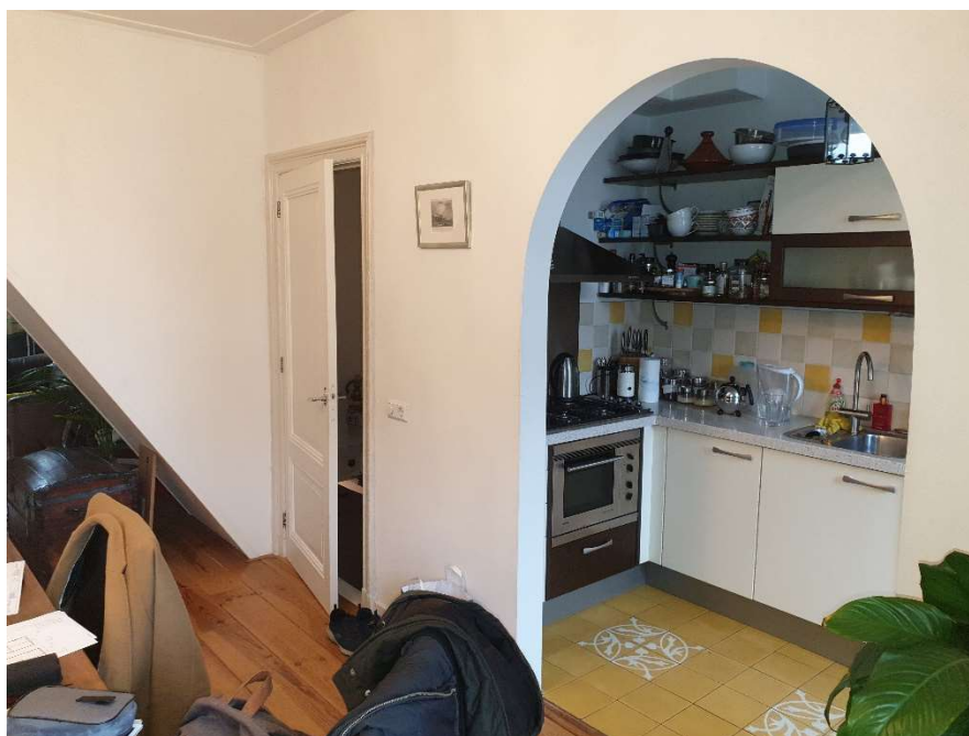
Afbeelding 2 Wand binnen tussen woonkamer en keuken.