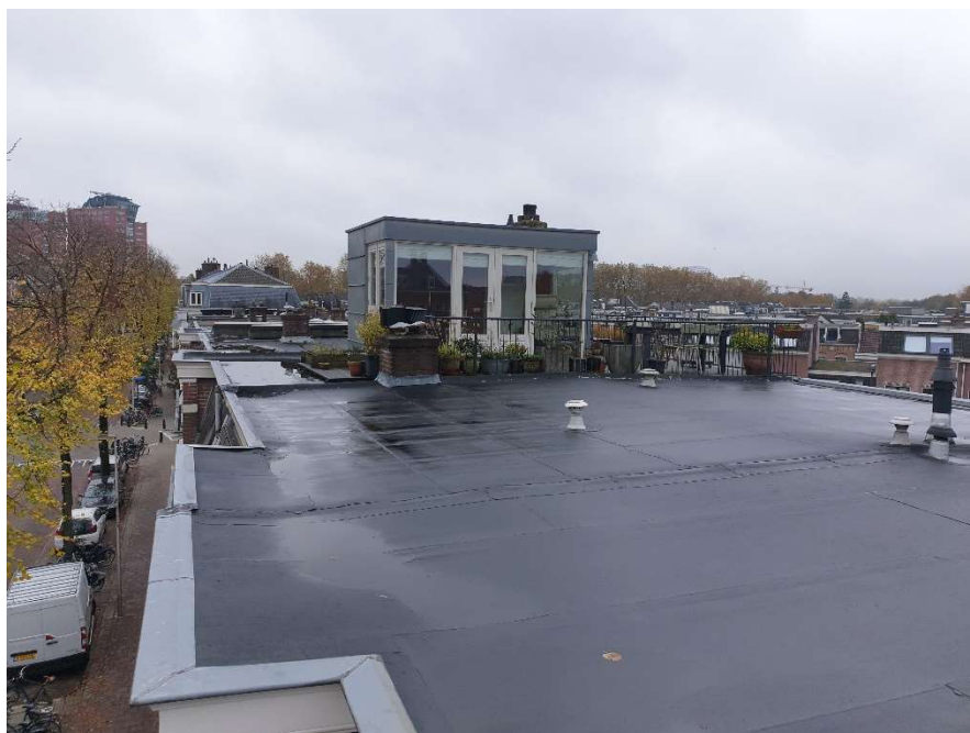
Afbeelding 6 Aanzicht opbouw met terras burenr. nr 38.